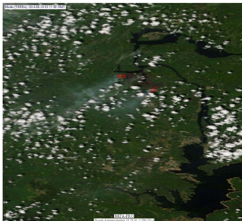
Рис. 2 Пожары в Иркутской области

(Информация подготовлена на основе данных центров приема НИЦ "Планета" ( http://planet.iitp.ru/index1.html ), спутникового сервиса ВЕГА ( http://pro-vega.ru ) и открытых зарубежных источников)