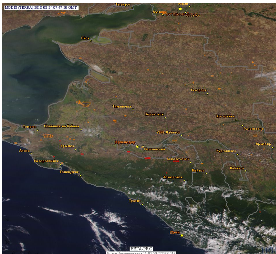
Рис. 1 Пожары в Краснодарском крае

Огнем было затронуто около 0,4 тыс га территории, покрытой лесом