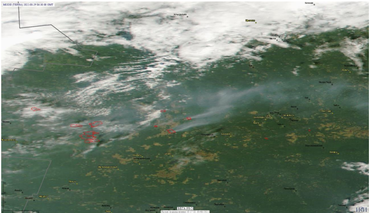
Рис. 2 Пожары в Республике Коми