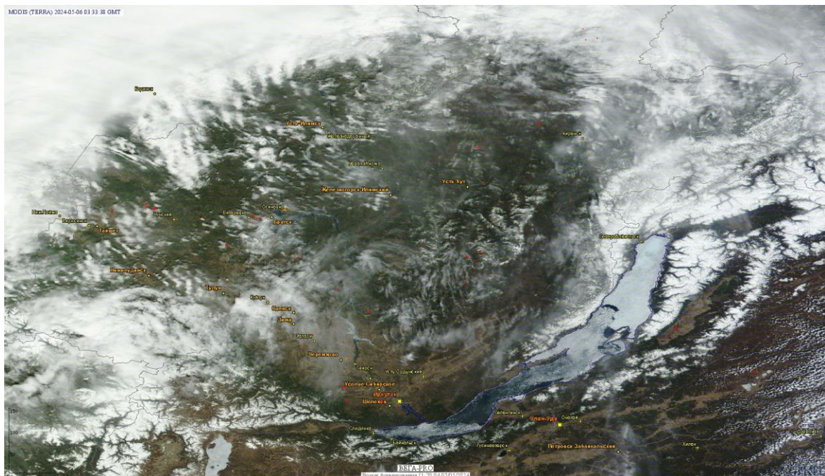
Рис. 1 Пожары и сельскохозяйственные палы в Иркутской области

Огнем было затронуто около 197,4 тыс га территории, покрытой лесом.